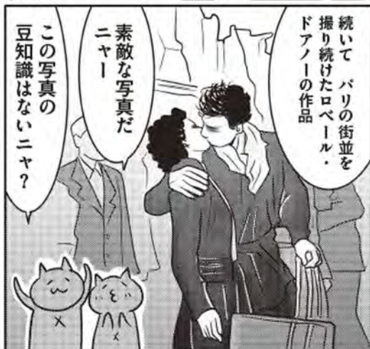
ロベール・ドアノ(1912~1994) 「市役所前のキス」1950年