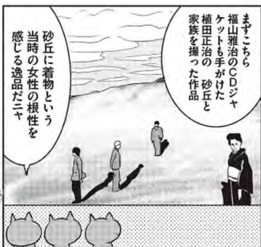
植田正治(1913~2000) 『妻のいる砂丘風景』1950年頃