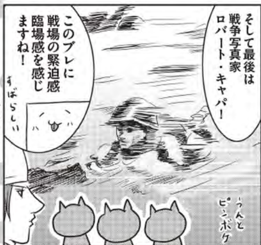
ロバート・キャバ(1913~1954)「オマハビーチ D-デイにノルマンディー海岸に上陸するアメリカ部隊」1944年6月6日