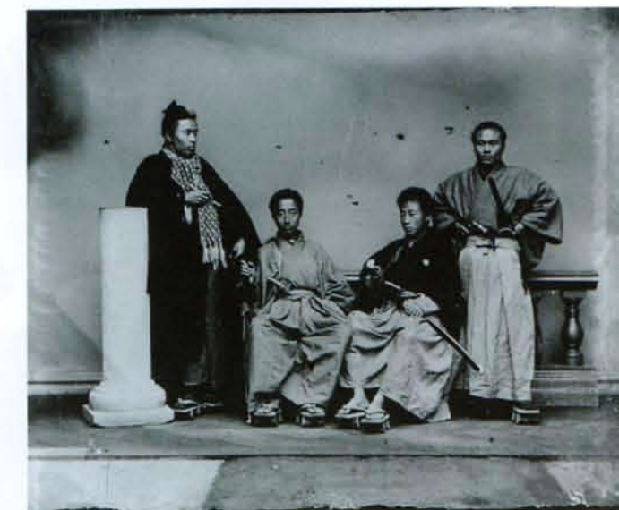
上野彦馬 松平忠礼と三人の男 1872~73年頃