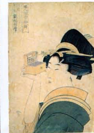
喜多川歌麿画 婦人相学拾射 覗き眼鏡を見る美人(神戸市立博物館蔵)