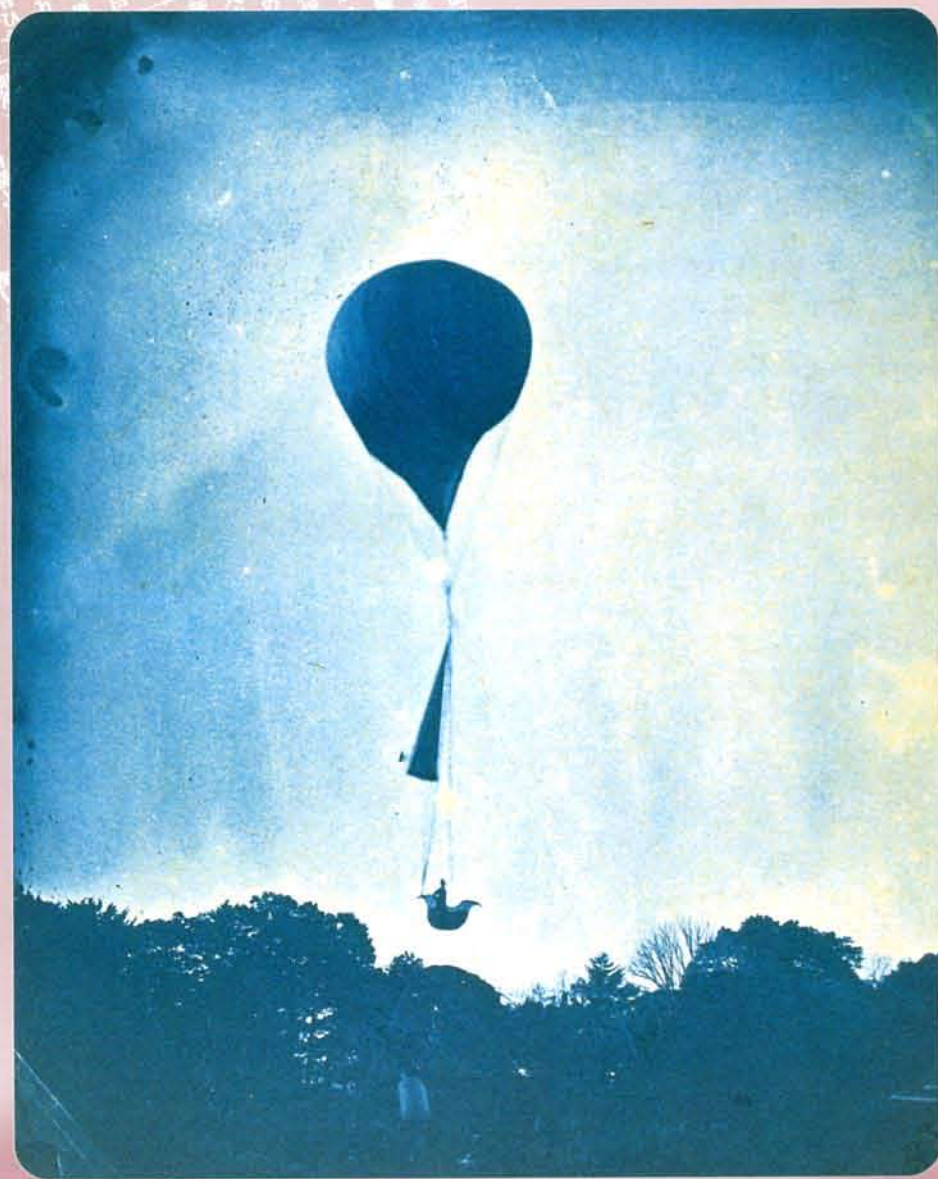
横山松三郎 軽気球の飛揚実験 「祖父松三郎遺影」アルバムより 明治11年(1878年)6月10日(個人蔵)