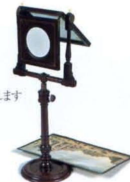
反射式覗き眼鏡(オランダ製) 18世紀中頃 (神戸市立博物館蔵)

●本展覧会は北海道立函館美術館へ巡回します。 会期=1997年4月5日~5月12日