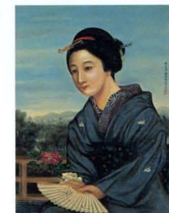
島霞谷 美人図 油彩「大日本霞谷写真」の署名 (東京国立博物館寄託)