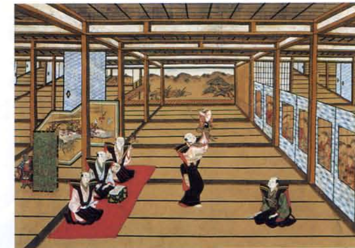
浮絵 座敷人形遣図 18世紀中頃(神戸市立博物館蔵)

交通機関=JR恵比寿駅東口より徒歩7分(恵比寿ガーデンプレイス内) お車での来館はご遠慮ください。