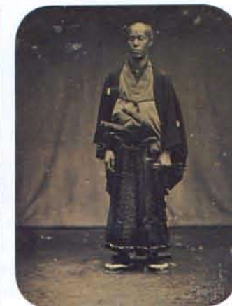
エリファレット・ブラウン・ジュニア 田中光儀像 1854年(東京都写真美術館寄託)