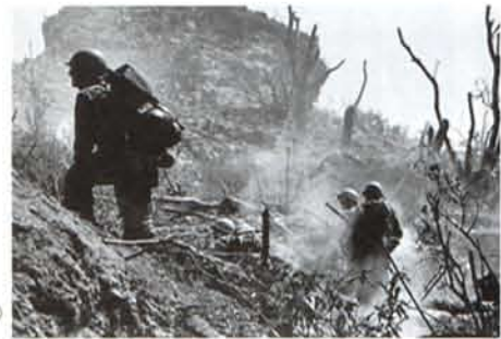
『沖繩(首山)』1945年 (Collection of the Center for Creative Photography) © 1982 The Heirs of W. Eugene Smith