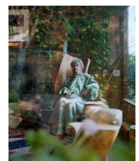
アレック・ロス 《Anna, Kentfield, California》、《I Know How Furiously Your Heart is Beating》より 2017年