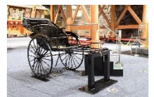
人力車(複製) 明治時代

※事業名は変更する場合があります。会期は予定です。 上記以外の事業については、別紙をご覧ください。 ※一部施設では夏季期間中に「サマーナイトミュージアム」(夜間特別開館)を 開催予定です。 ※今後の状況により、予定が変更となる場合があります。 ※事業は、東京都令和6年度予算が東京都議会で可決された場合及び、 公益財団法人東京都歴史文化財団令和6年度予算が財団理事会で可決され、 同評議員会が承認した場合に確定します。