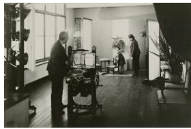
常盤台写真場 昭和12年

街の写真師たちが遺したものの 特別展 街に写真館のあった頃 ～常盤台写真場と昭和モダン～