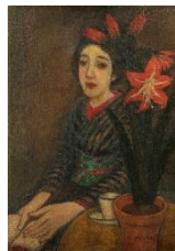
竹久夢二《アマリス》夢二郷土美術館蔵