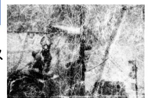
エド・カー 《FOX TOOTH》2023

6か国12名のアーティストが参加 トーキョーアーツアンドスペース レジデンス2024成果発表展