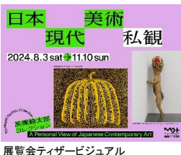
展覧会ティザービジュアル