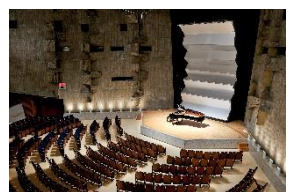
東京文化会館 小ホール