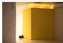
【参考画像】飯川雄大 《デコレータークラブ 配置・調整・周遊》2020年 展示風景：ヨコハマトリエンナーレ 2020 「AFTERGLOW 一光の破片をつかまえる」 PLOT48