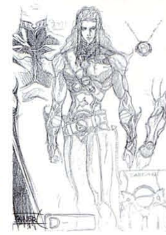
(上)「エースコンバット3 エレクトロスフィア」 株式会社ナムコ 1999年 (下)「バンバイアハンターD」キャラクター設定 有限会社マッドハウス 1999年